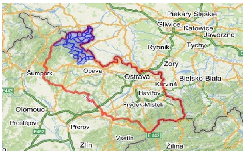
Obrázek 2 Území působnosti MAS Rozvoj Krnovska v kontextu regionů NUTS2 a NUTS3