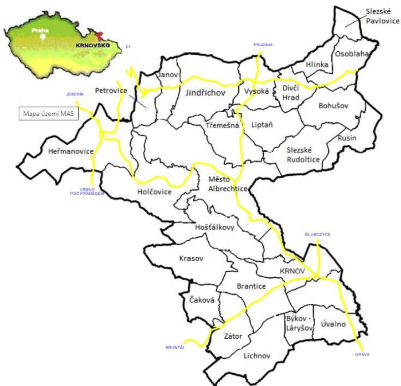
Obrázek 1 Území působnosti MAS Rozvoj Krnovska s vyznačením názvu obcí